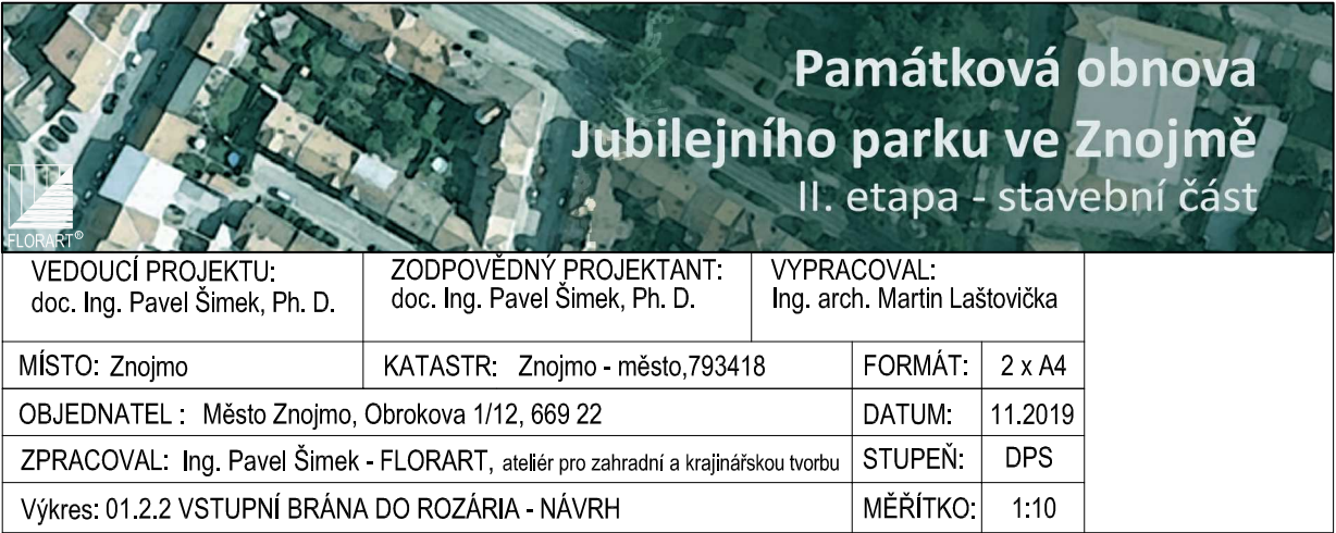
SO 01 VSTUPNÍ BRÁNA DO ROZÁRIA - NÁVRH OBNOVY